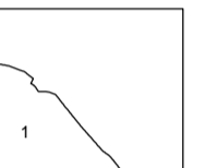
Hranica obvodu PU